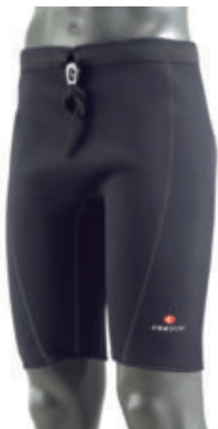
9102 PANTALONI DIMAGRANTI in neoprene foderato, taglio anatomico, con laccio in vita misure: S - M - L - XL