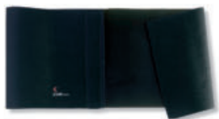
9107 PANCERA DIMAGRANTE misure: cm 107x28x0,4