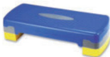
9623 AEROBIC STEP in materiale plastico, altezza variabile (cm 10-15) misure: cm 66x29