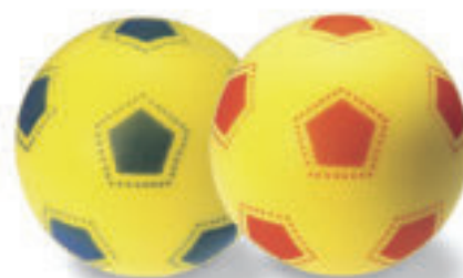
3612 PALLA GOMMASPUGNA circonferenza cm 61 - colori assortiti peso 180 gr.