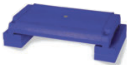
9621 AEROBIC STEP in materiale plastico, altezza variabile (cm 10-15-20) misure: cm 70x40