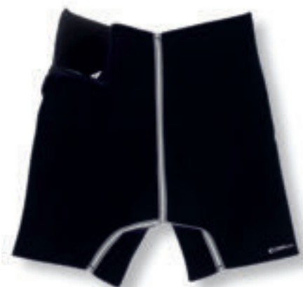
9103 CALZONE DIMAGRANTE misure: M - L - XL