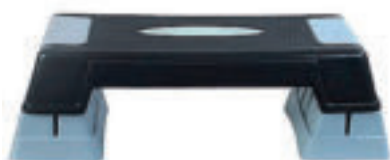
9625 AEROBIC STEP in materiale plastico, altezza variabile (cm 12-17-22) misure: cm 63x27