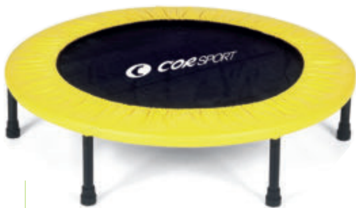
9949 MINITRAMPOLINO portata max 100 kg. Ø cm 98