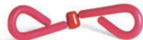
9619 THIGH SHAPER per esercizi addominali