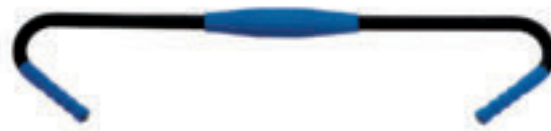
9617 ACTION BAR attrezzo multiuso adatto per rassodare e sviluppare i muscoli delle braccia.