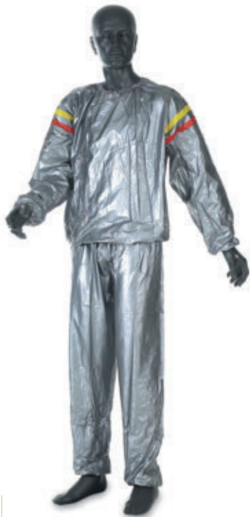
9100 TUTA PER SAUNA misure: S - M - L - XL