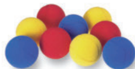
3613 PALLINA SPUGNA ALTA DENSITA' colori assortiti peso 12 gr. - diam. 7 cm. - circ. 22 cm.